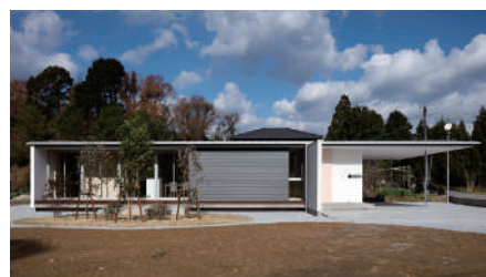
ASJ四万十スタジオ施工物件 (左から) 設計:細川範規 / 設計:株式会社風標社 / 設計:開達也